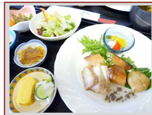
伊達の燻製ランチ