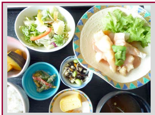
本日のお魚とお野菜のランチ