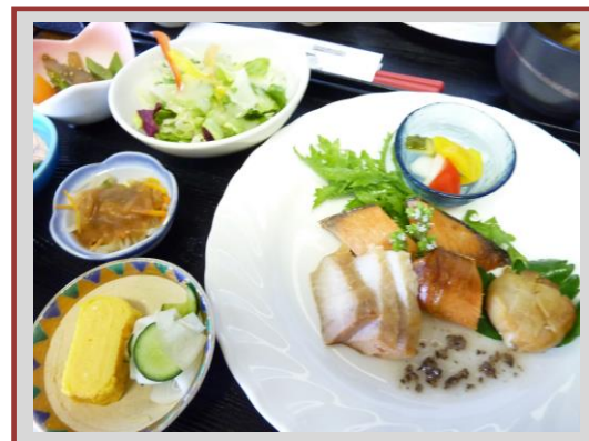
伊達の燻製ランチ